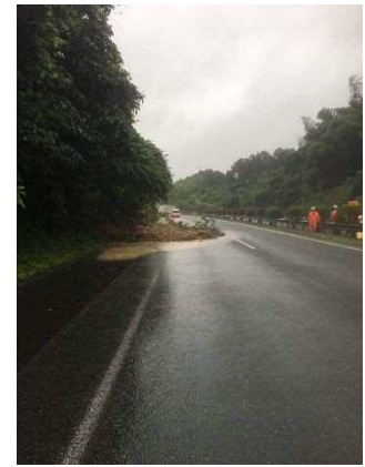
⑥ 九州自動車道 若宮 IC~古賀 IC(上・下) 切土のり面表層流出 お客さまへの被害 なし