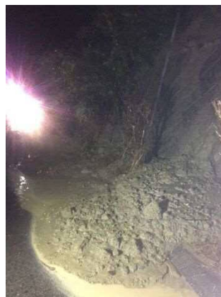
② 山陽自動車道 三木 JCT～神戸西 IC(下) 切土のり面表層流出 お客さまへの被害 なし