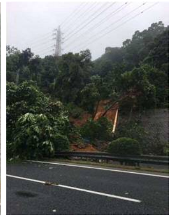
⑬ 九州自動車道 新門司 IC～小倉東 IC(上下線) 切土のり面崩落 お客さまへの被害なし