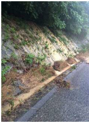
⑦ 九州自動車道 小倉東 IC~新門司 IC(上) 切土のり面表層流出 お客さまへの被害 なし