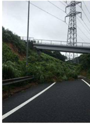
⑧ 九州自動車道 壇ノ浦 PA オンランプ 切土のり面表層流出 お客さまへの被害 なし