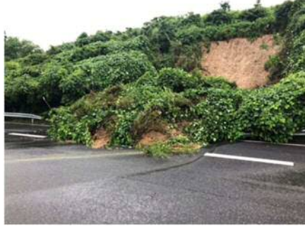
⑤ 中国自動車道 小月 IC~下関 IC(下) 切土のり面表層流出 お客さまへの被害 なし