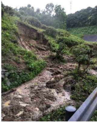
④ 中国自動車道 吉川 IC オンランプ 切土のり面表層流出 お客さまへの被害 なし