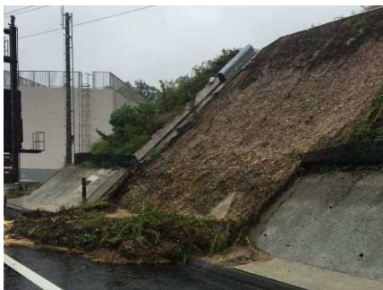
① 新名神高速道路 川西 IC～箕面とどろみ IC(上) 切土のり面表層流出 お客さまへの被害 なし