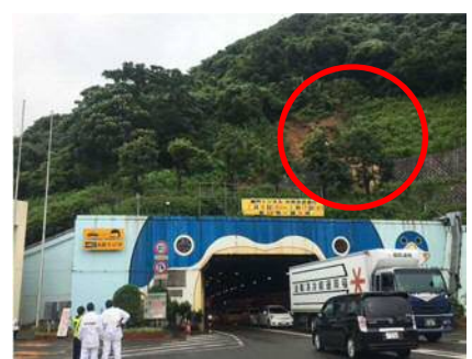
⑫ 関門トンネル 下関 IC~門司 IC 門司坑口 切土のり面表層流出 お客さまへの被害 なし