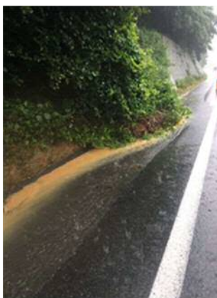
⑩ 九州自動車道 小倉東 IC~新門司 IC(上) 切土のり面表層流出 お客さまへの被害 なし