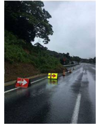
⑨ 九州自動車道 下関 IC~門司 IC(下) 切土のり面表層流出 お客さまへの被害 なし