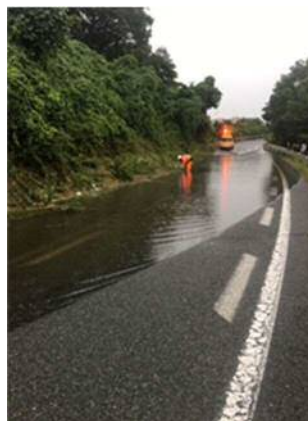
⑪ 九州自動車道 古賀 IC オフランプ 路面冠水 お客さまへの被害 なし