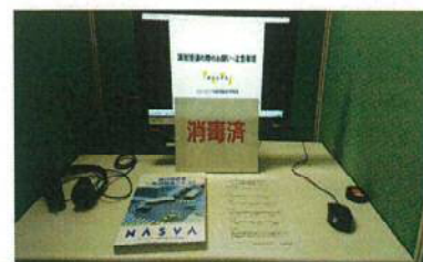
イメージ（動画視聴方式）