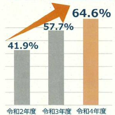
主要な届出の電子申請割合