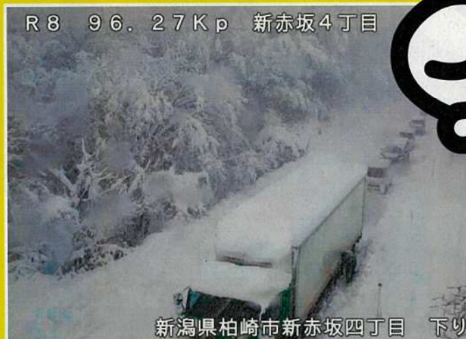
R8 96.27Kp 新赤坂4丁目